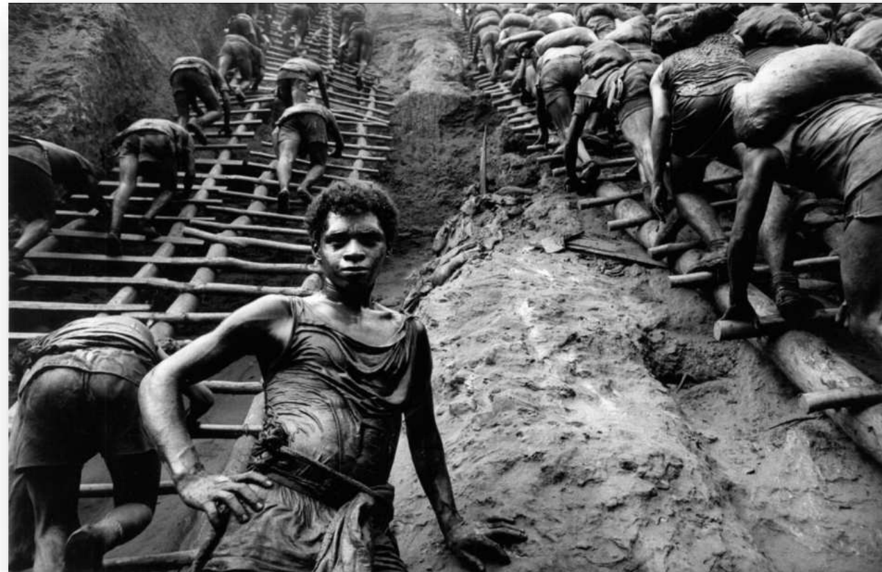
Sebastião Salgado, Brazil