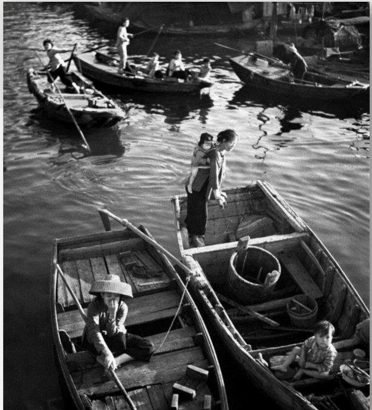
Fan Ho, Boat People 1962