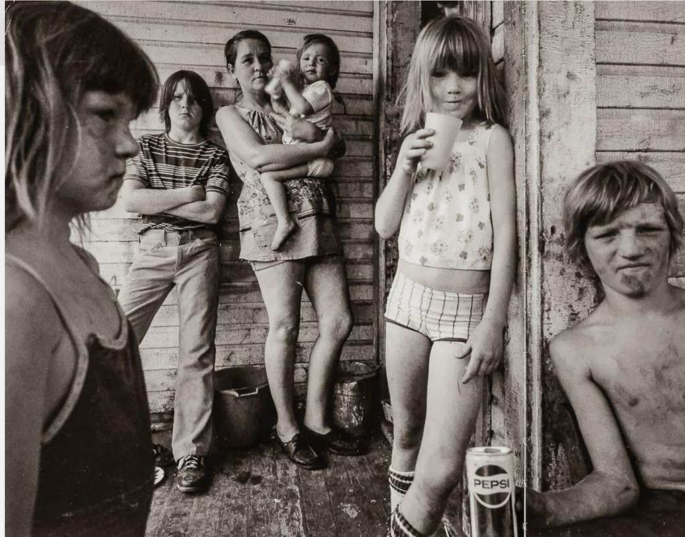
Nicholas Nixon, Sympathique, Virginie-occidentale, 1982

En introduisant un ordre à cette situation, le photographe résout une image plus qu'il ne la compose