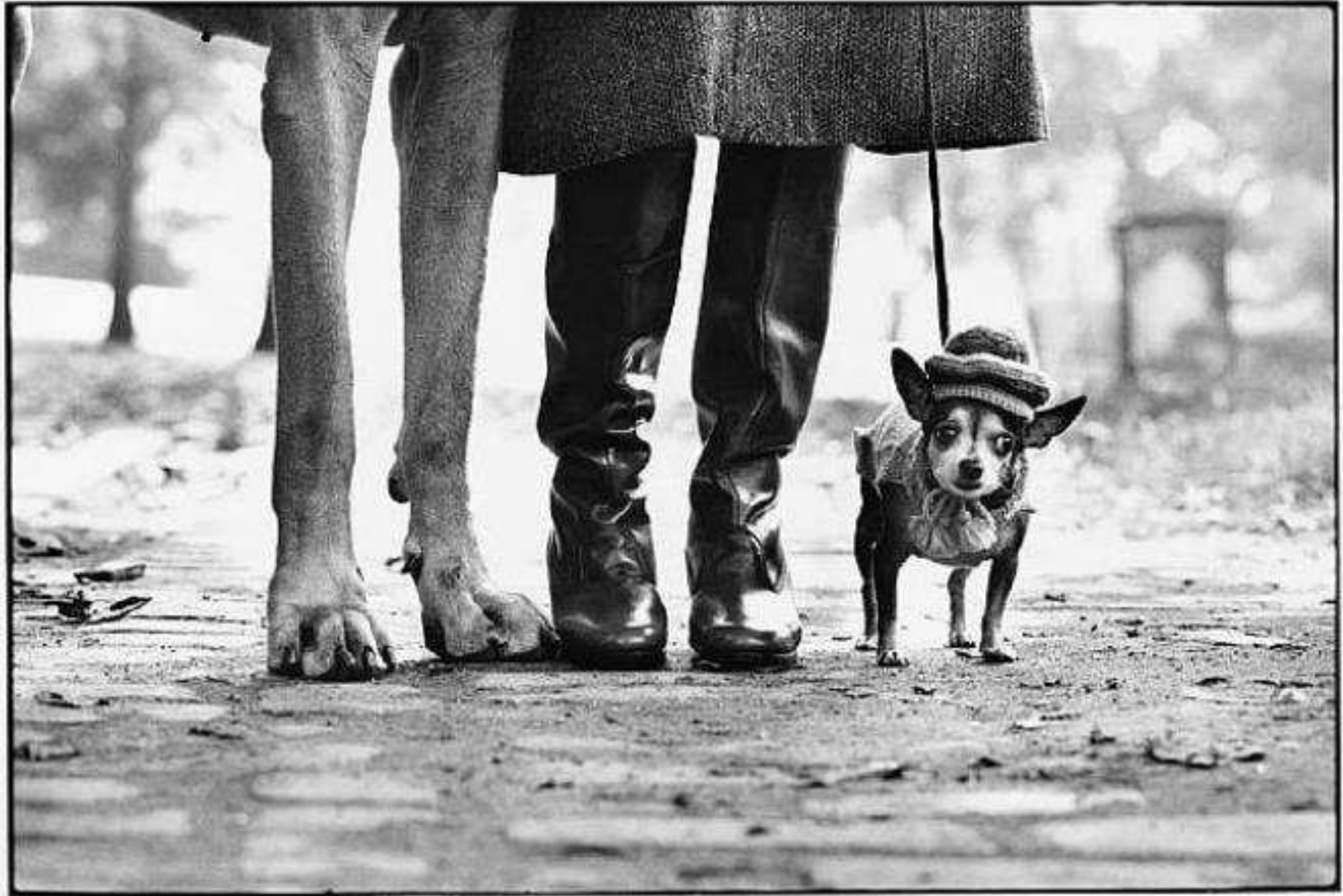
Elliot Erwitt, New York