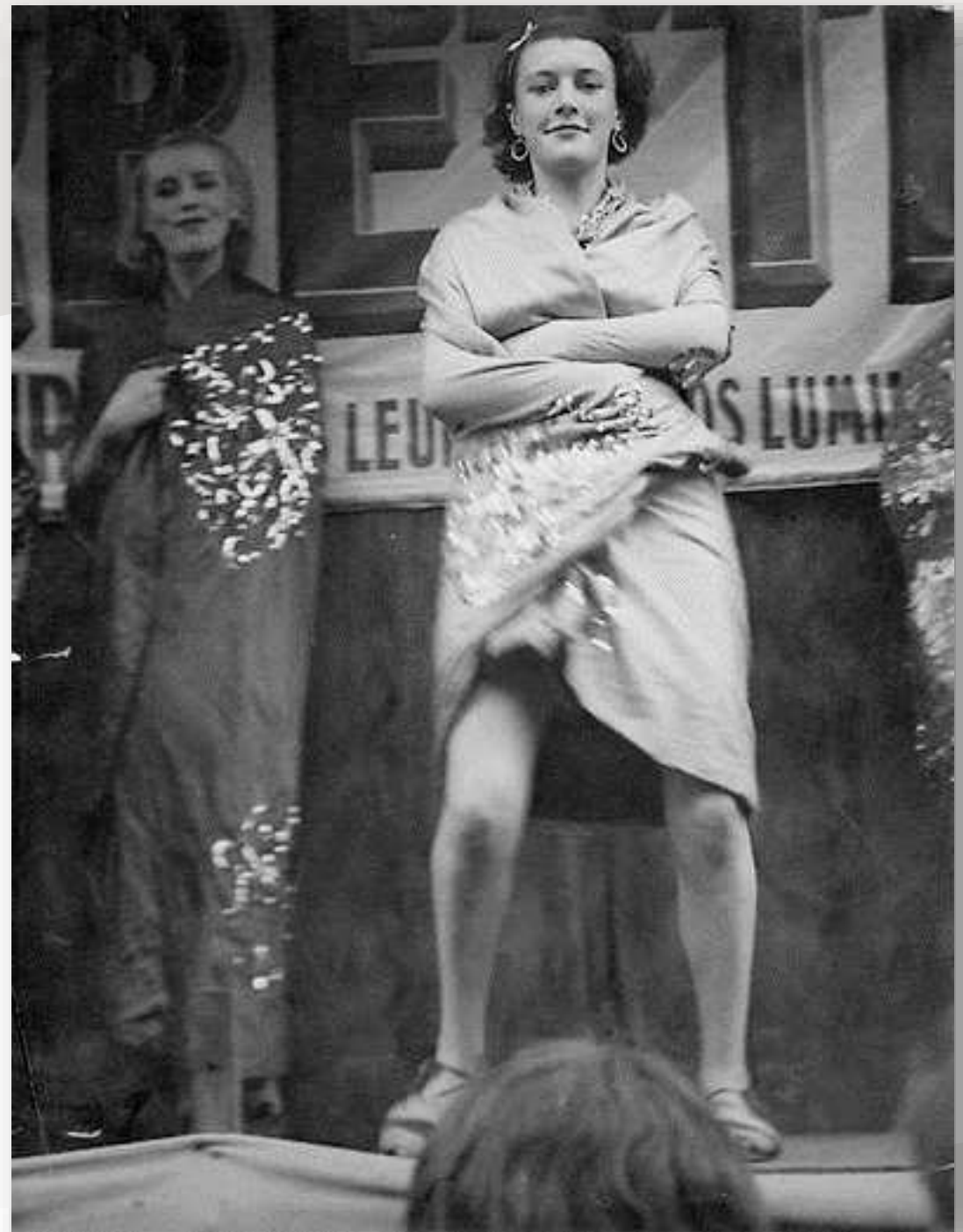
Brassai, Quartier latin, 1932