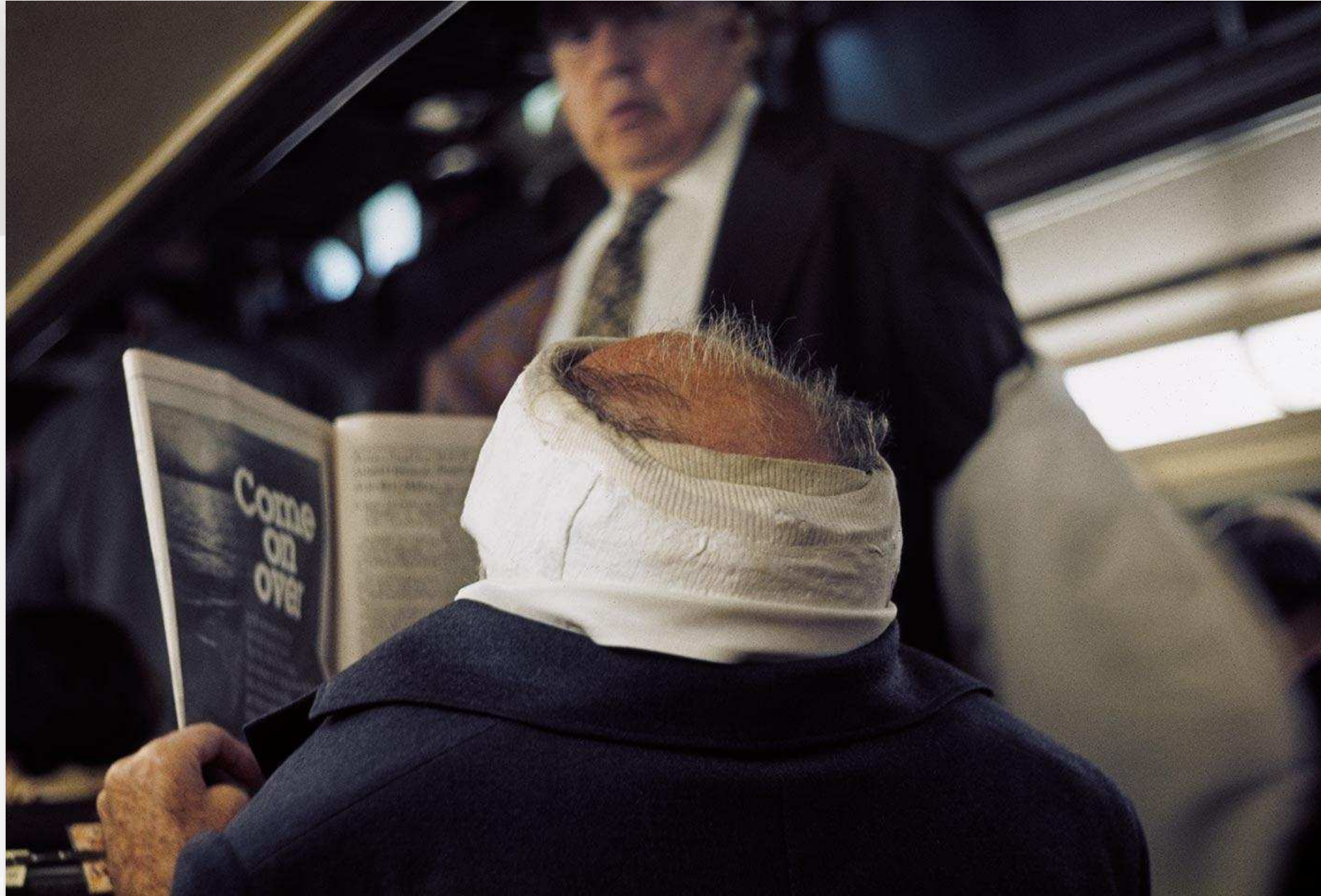
Vivian Maier, May 1976