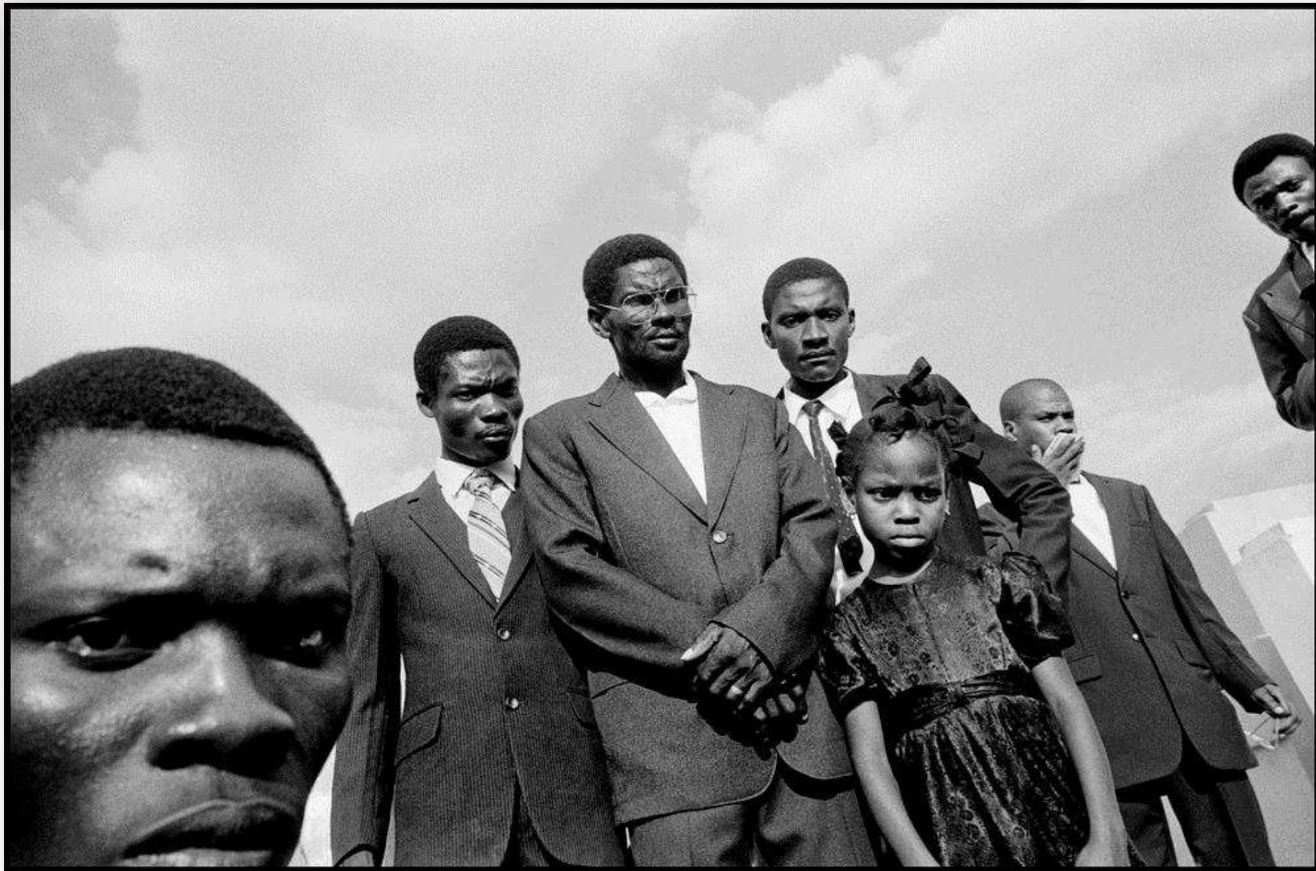
Haiti