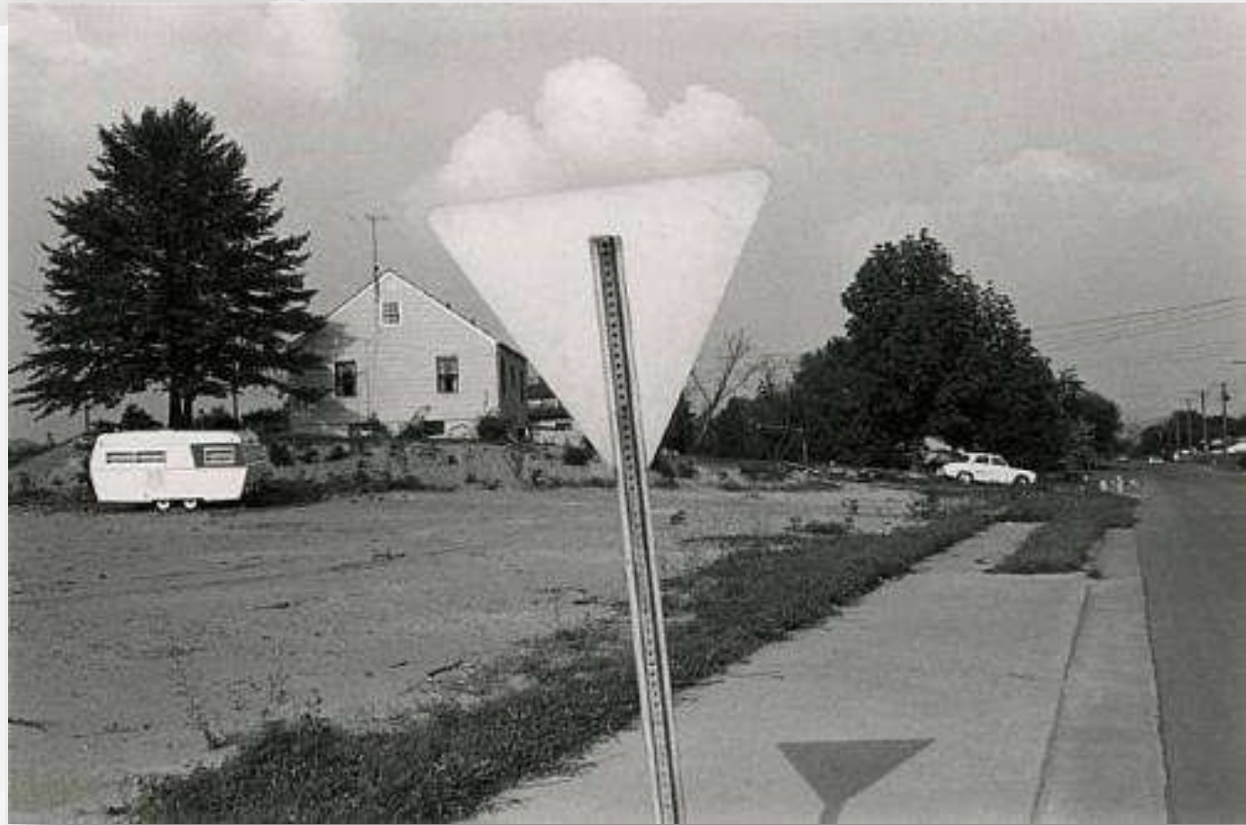
Lee Friedlander, Knoxville, Tennessee, 1971

Dire que de nouveaux rapports apparaissent ne signifie pas que le panneau de priorité et le nuage ne se trouvaient pas face à l'appareil, mais que leur rapport visuel, avec le nuage posé comme de la barbe à papa sur le panneau, est produit par la vision photographique.